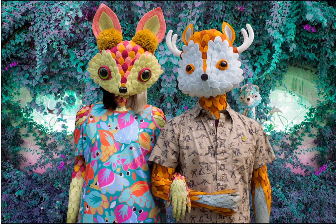
Horrible Adorables - Justin Case